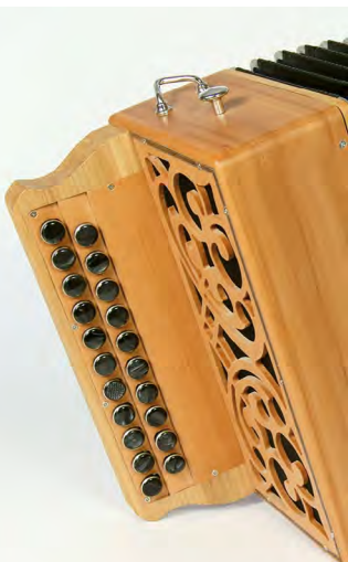
Nuit des Conservatoires