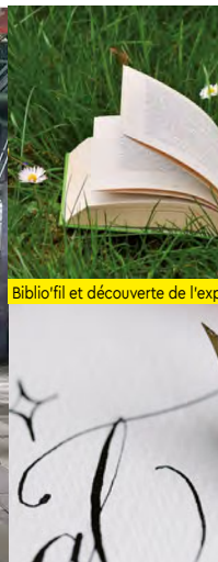
Biblio'fil et découverte de l'exposition