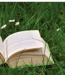
Exposition Maja Bajevic, Echos