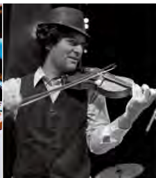
Stand d'information en musique au marché