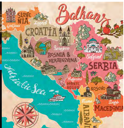
Contes / La belle du monde