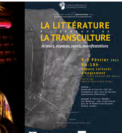
Littérature / Colloque