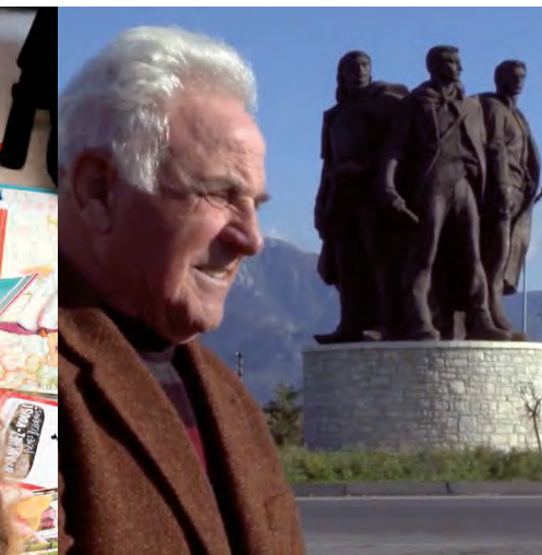
Conférence : Tranzicion, art et pouvoir en Albanie

Ouvert à toutes, inscription obligatoire (15 places max)